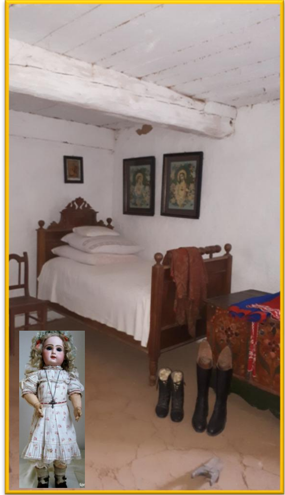
Drewniane łóżko, kołyska wszystko inne niż w czasach współczesnych.