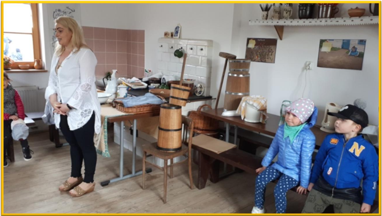
Tak dawniej wyglądała izba wiejska.