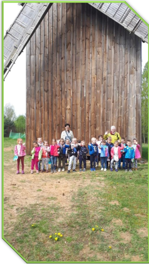
Drewniany młyn, w którym dawniej mielono zboże na mąkę.