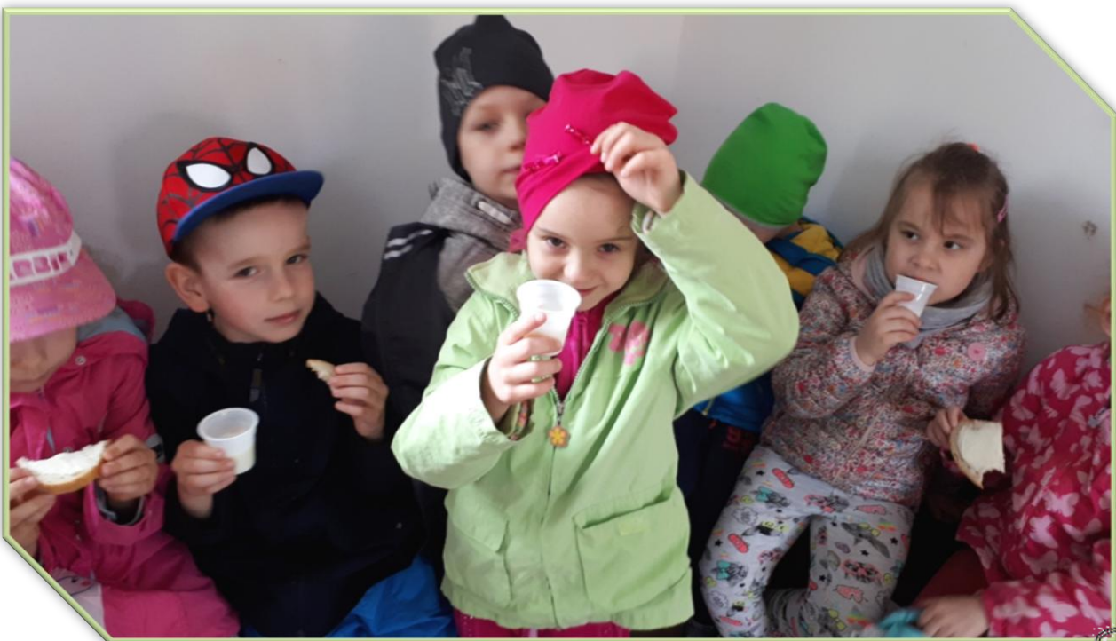
Do tego wszystkiego łyk świeżego mleka - smacznego!!!