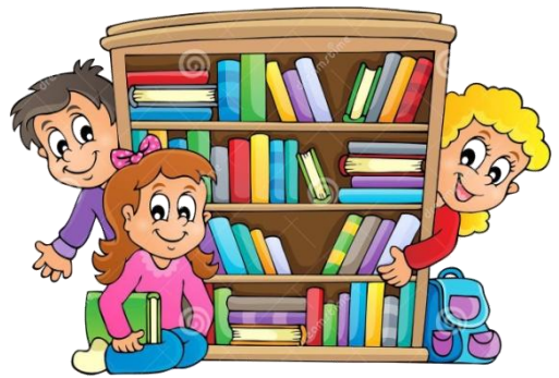
Uroczyste otwarcie „Przedszkolnego Punktu Wymiany Książek”.