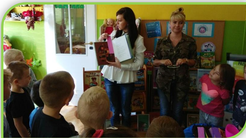
Każda książka potrzebuje też zakładki!!!