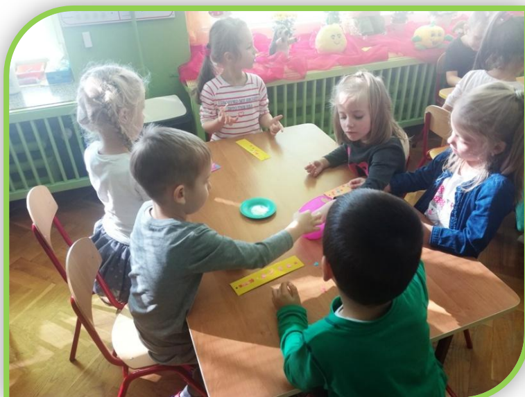
A oto nasze zakładki!!!