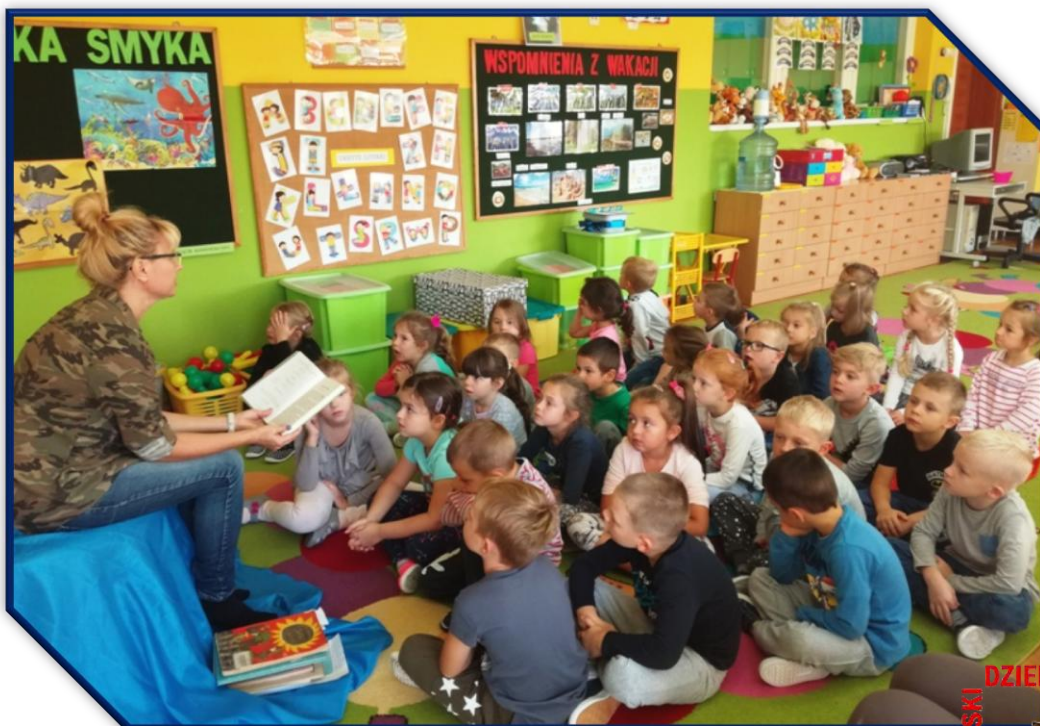
Słuchamy bajki czytanej przez panią bibliotekarkę.