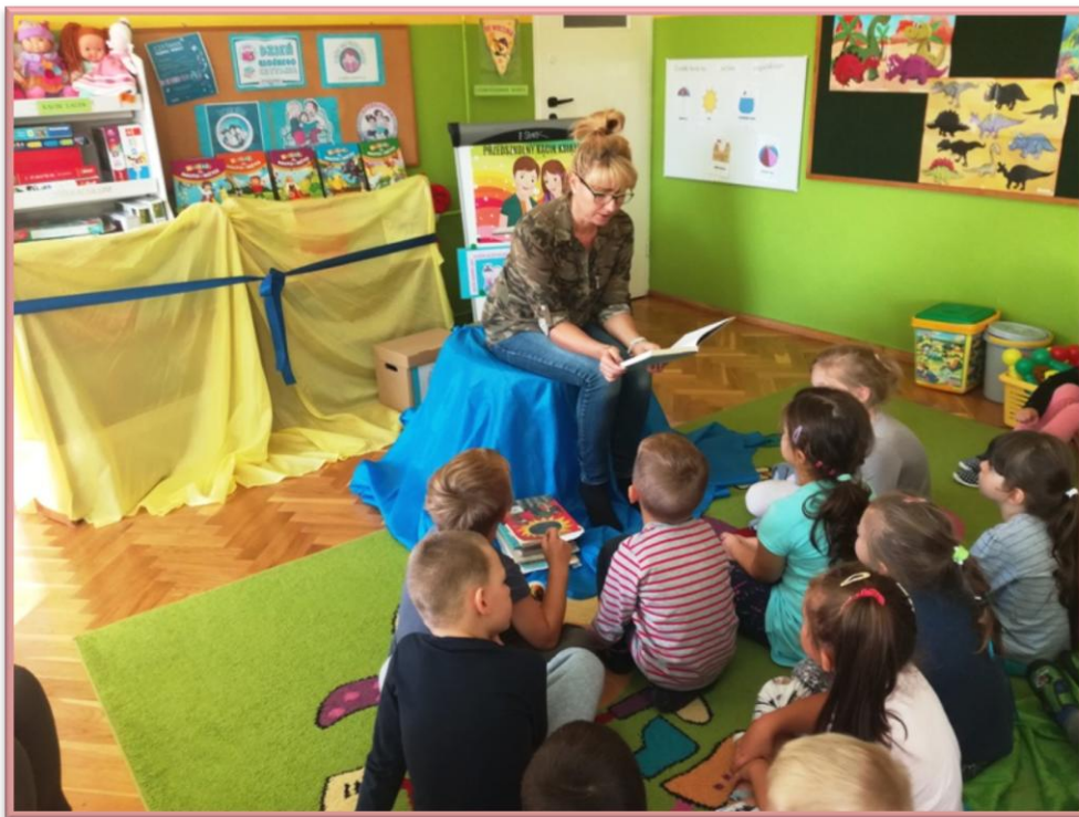
Spotkanie z panią bibliotekarką w przedszkolu.

odbyło się uroczyste pasowanie „Kotków” i „Żyrafek” na czytelników - każdy przedszkolak otrzymał czytelniczy dyplom „Przyjaciela książki”.