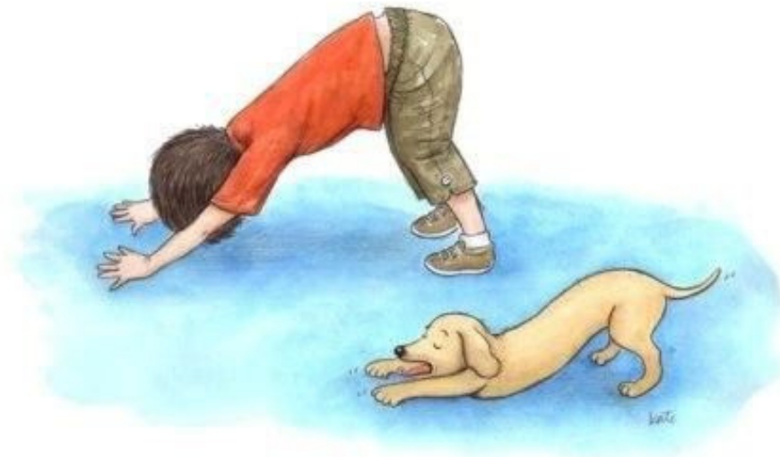
pozycja psa z głową w dół