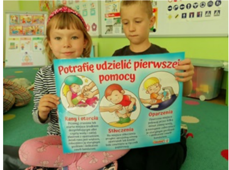
utrwalenie wiedzy na temat udzielania pomocy podczas skaleczeń