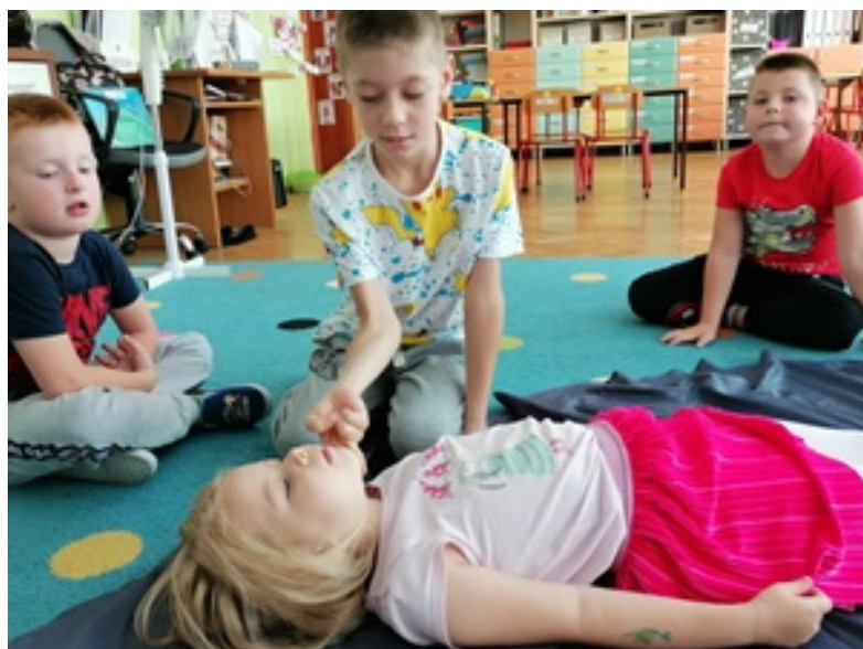
wskazanie kolejno czynności podczas udzielania pomocy