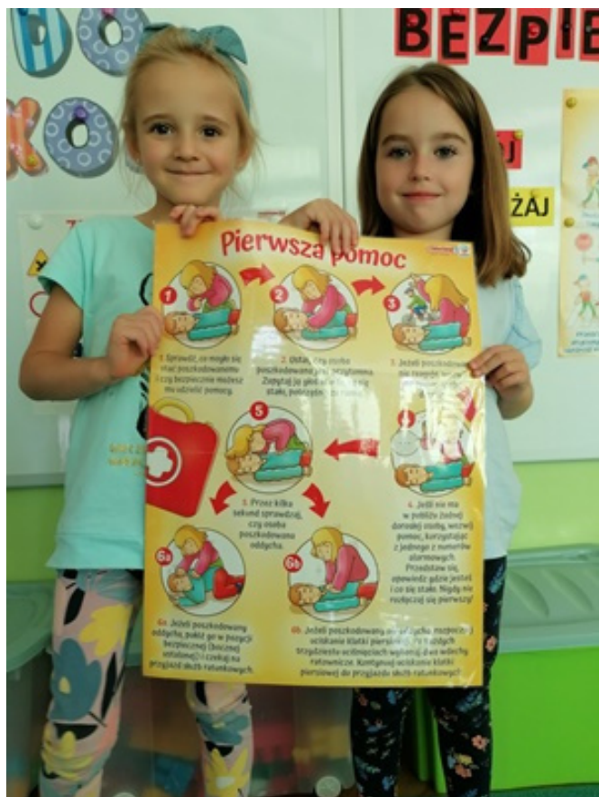
poznanie zasad udzielania pierwszej pomocy

Dzieci z grupy "Kotki" poznały zasady udzielania pierwszej pomocy oraz udzielania pomocy podczas skaleczeń.