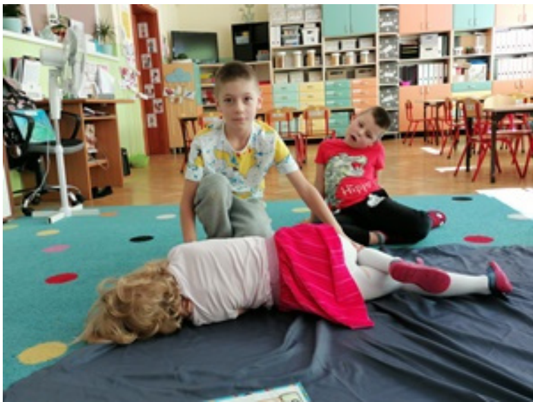
praktyczne zabawy - pozycja boczna bezpieczna