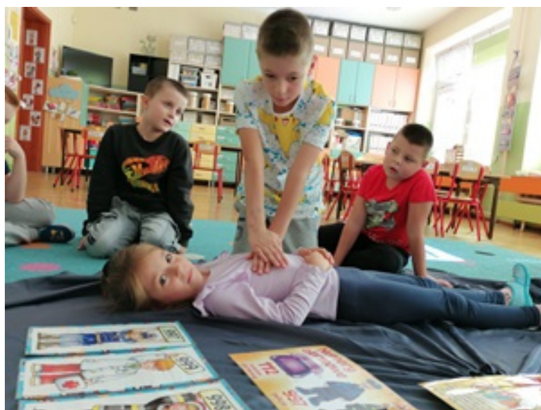
utrwalenie wiedzy na temat wykonywania 30 uciśnień i 2 wdechów